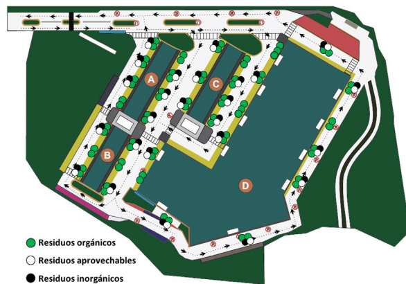
Distribución de canecas en la Central de Abastos de Villavicencio